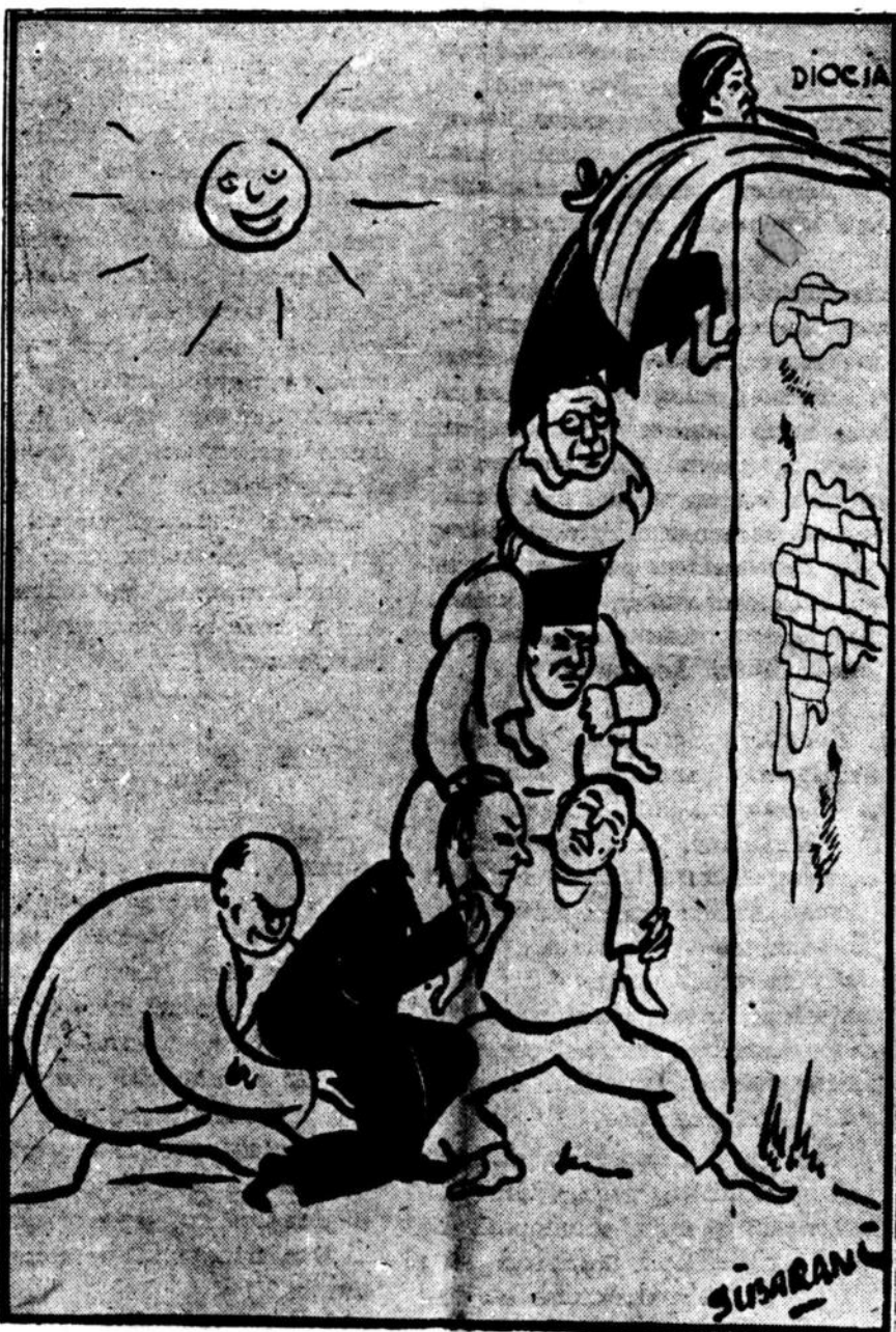
Rembate... rata... akhirnya sampai ke Jogja...

Djadi tidak perlu hidjarah tapi hal ini baru diselesaikan nanti dalam sidang kabinet. Soal BFO di terangkan bahwa BFO ikut membantu tertjapainja perstudjian R-R 7 Mai dan selanjutnja pendiriannya mengenai Nieuw Guinea: pihak BFO tegas menghendaki supaya Nieuw Guinea djuga dimasukkan dalam bagian NIS djangan merupakan daerah dari kera